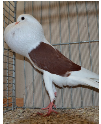
V - Matthias Holzhauser - rot