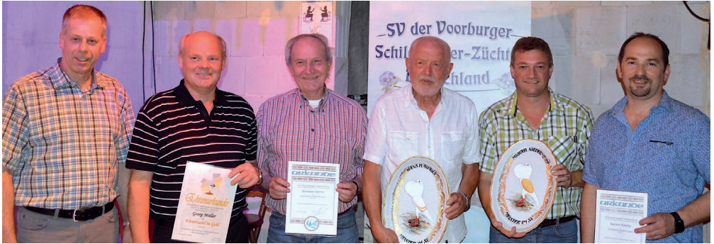
Gruppenbild der anwesenden Geehrten anlässlich der Sommertagung