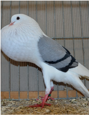
V - Franz Liebl, blau m. schw. Bd.