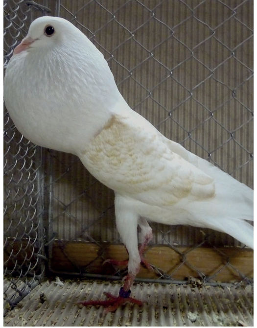
1,0 gelb-ges. HSS Bad Nauheim, hv 96, Seb. Niedermeier (Jugend)