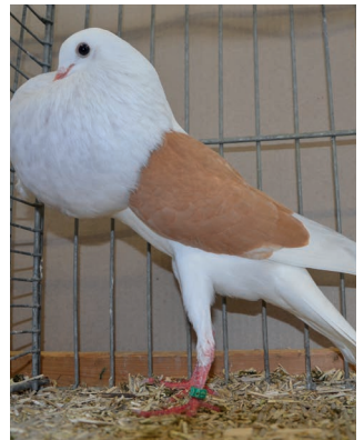
V - ZG Niedermeier - gelb