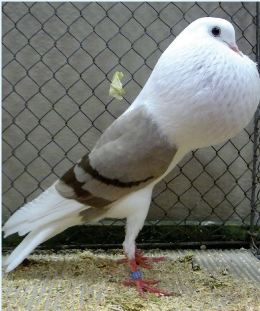
0,1 braunfahl, HSS Bad Nauheim, hv 96, G. Baumgartner