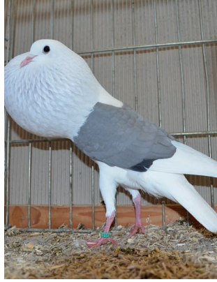
HV-Edmund Kutscherauer, blau