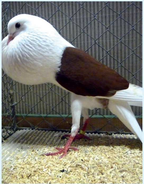
0,1 alt. rot, HSS Bad Nauheim, V 97, K. Kipping