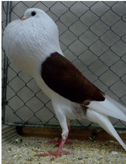
1,0 rot, HSS Bad Nauheim, V 97, M. Holzhauser