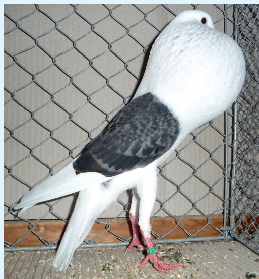
Champion 0,1 blau-gehämmert Franz Liebl