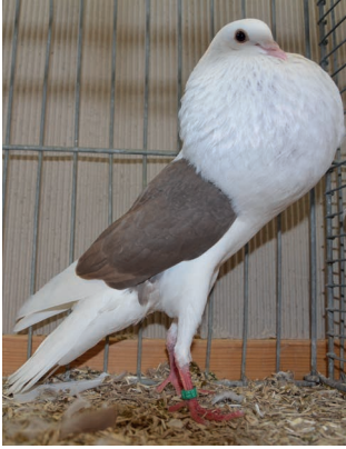
HV - Patrick Trimpl, braun