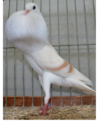
V - Franz Hötschl - gelbfahl