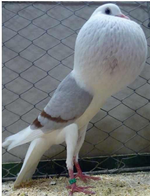
0,1 rotfahl, HSS Bad Nauheim ,V 97,H.-P. Flauaus