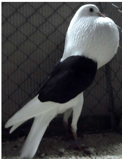
1,0 schwarz, HSS Bad Nauheim, V 97, K.-F. Schwalm