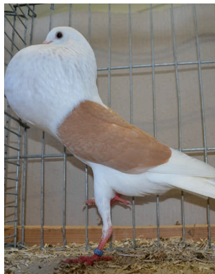
V - ZG Niedermeier - gelb