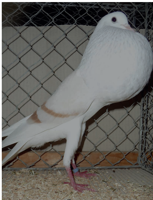
0,1 gelbfahl, HSS Bad Nauheim V 97 EB, J. Mandlmeier