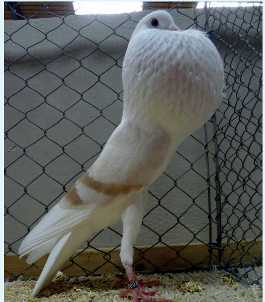
0,1 gelbfahl, HSS Bad Nauheim, V 97, H.-P. Flavaus